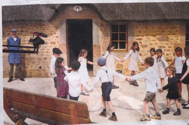
Une douzaine d'enfants de la Hague ont vécu leur première expérience de tournage, dans cette scène au moulin Marie-Ravenel de Réthoville.

Site : https://fr.ulule.com/mr-ribouldingue ; pages Facebook et YouTube « Mr. Ribouldingue »